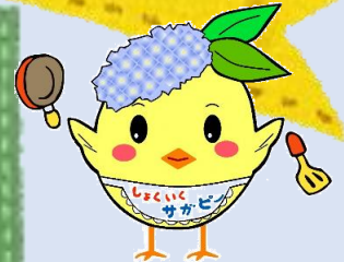
相模原市食育推進 マスコットキャラクター サガビー